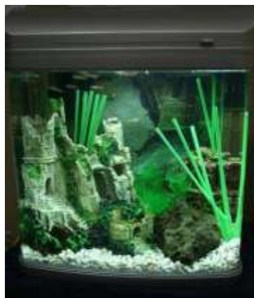
Eks. På Freestyle akvarie

Klasserne er beskrevet på www.akvariedommer.dk