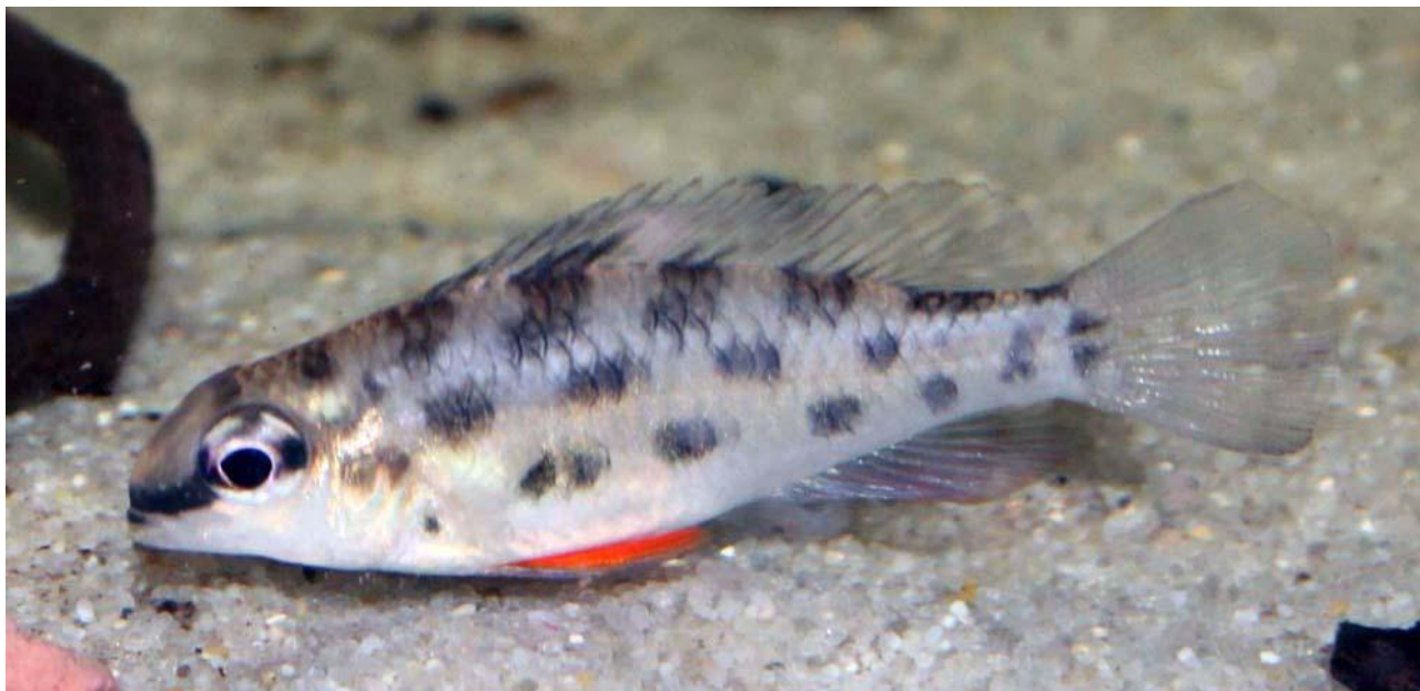
Dicrossus foirni , hun.

Vand: 25-28 grader C. pH 6,5. Hårdhed 0.