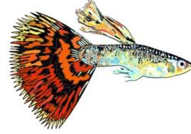
Fyns Akvarieforening Fyns Akvarieforening