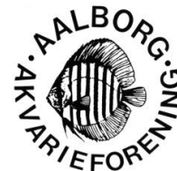
Aalborg Akvarieforening Facebook