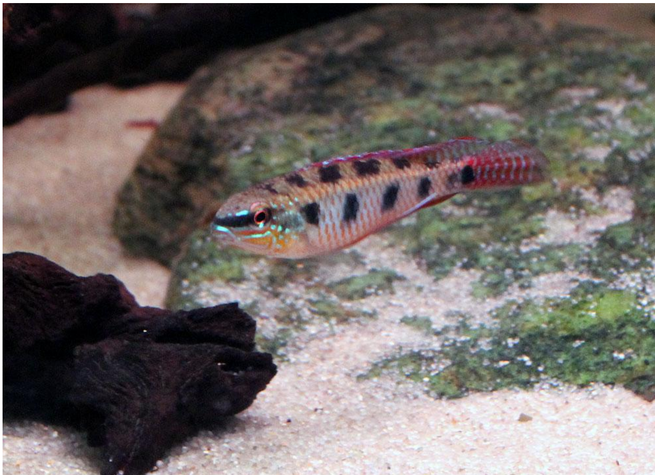
Dicrossus maculatus , han.