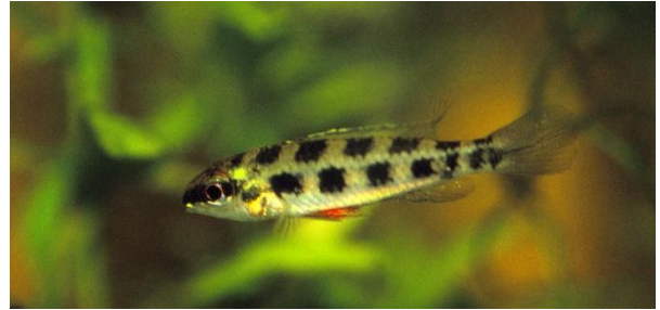
Dicrossus filamentosus , hun.

Hannerne af de 5 videnskabelige kendte arter, som bliver lidt større end hunnerne, kan opnå en længde på cirka 10 cm., mens hunnen kun bliver mellem 6 og 8 cm.