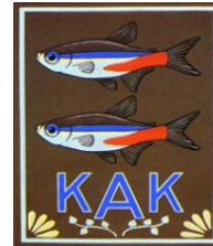
Storkøbenhavns Akvarie Klub http://www.kak.dk/