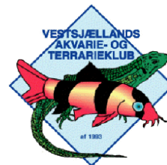
Vestsjællands Akvarie- og Terrariekлуб https://www.vatk.dk/