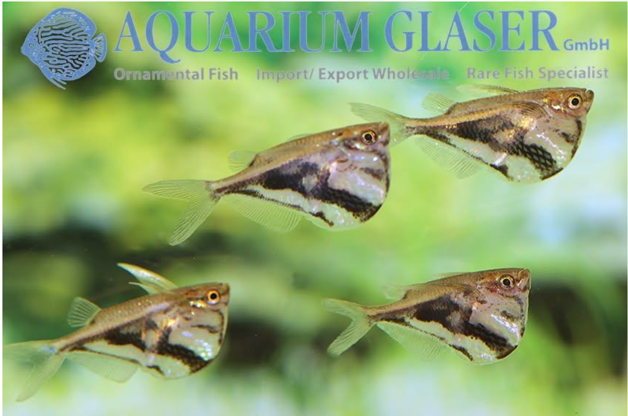
Carnegiella strigata "vesca".