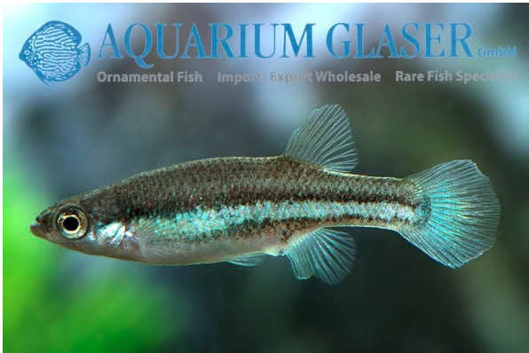
Ataeniobius toweri , han.

Ataeniobius toweri adskiller sig fra alle andre Goodeinae ved, at yngelen, som allerede er ret stor ved fødslen, mangler fødeårde (trofotaenia) på deres bug. Alle andre Goodeinae har disse. Trofotaenierne tjener til at nære yngelen i livmoderen under drægtighedsperioden. I modsætning til levendefødte tandkarper (f.eks. guppyer, platies, mollies osv.) er Goodeinae-arten "ægte levendefødte", hvilket betyder, at ungerne klækkes fra æggene i moderens livmoder og forsynes med næringsstoffer fra moderen indtil fødslen. Hos levendefødte tandkarper udvikler æggene sig dog i moderens krop indtil gydningen, til det punkt, hvor ungerne klækkes i gydeøjeblikket. Derfor kaldes de "æglevendefødte fisk".