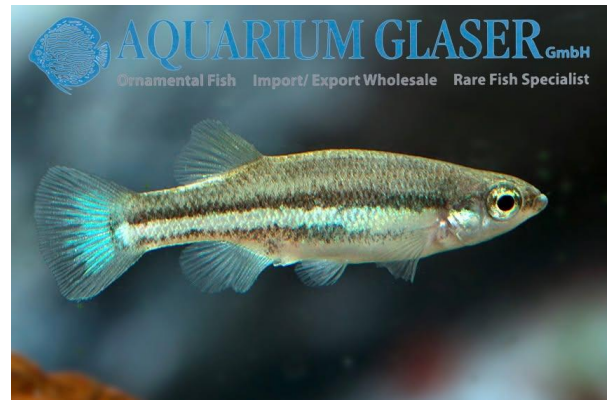
Ataeniobius toweri , han.

Centraleuropa, cirka maj til oktober) under vejrafhængige, svingende forhold. Dette gælder også for Ataeniobius toweri . Imidlertid synes netop denne art at være noget mindre problematisk til langvarig indendørs hold på grund af dens liv i termiske kilder.