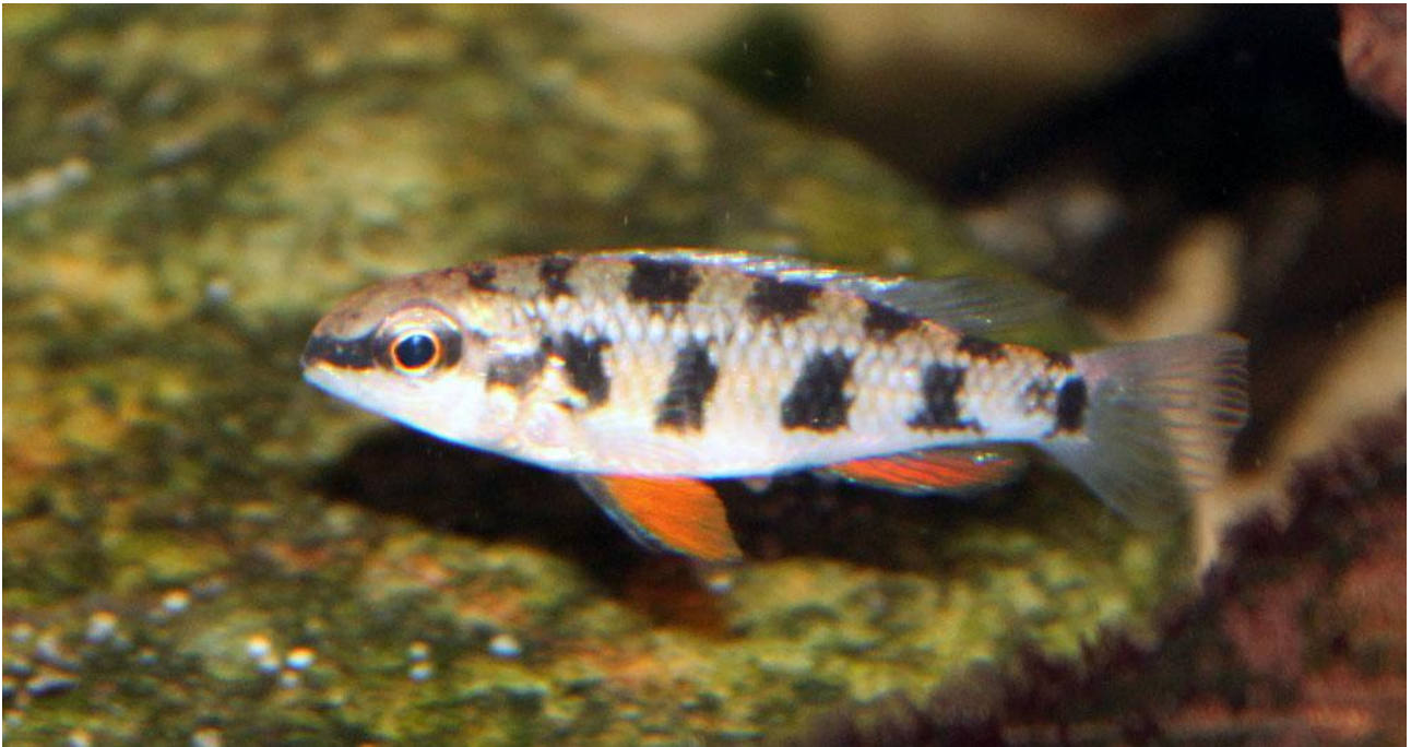
Dicrossus maculatus , hun.

Vand: 25-28 grader C. pH 5,5-6. Hårdhed 0.