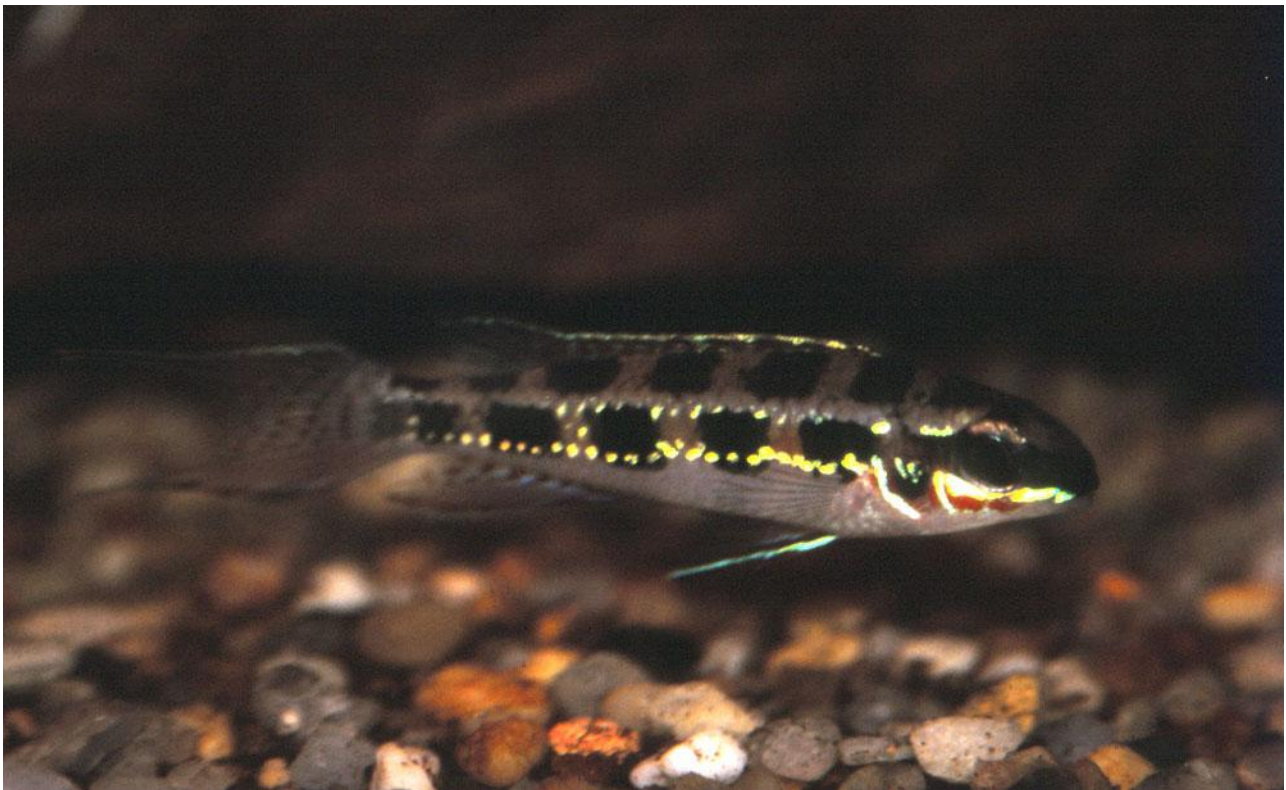
Dicrossus filamentosus , han.