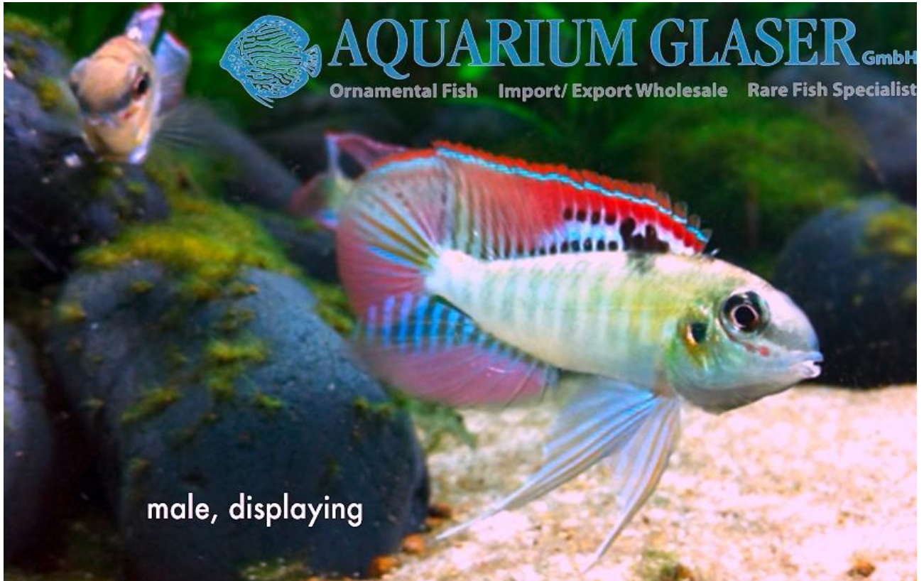
Dicrossus fornei , to hanner.