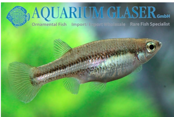
Ataeniobius toweri , hun.

Ataeniobius toweri adskiller sig fra alle andre Goodeinae ved, at yngelen, som allerede er ret stor ved fødslen, mangler fødeårde (trofotaenia) på deres bug. Alle andre Goodeinae har disse. Trofotaenierne tjener til at nære yngelen i livmoderen under drægtighedsperioden. I modsætning til levendefødte tandkarper (f.eks. guppyer, platies, mollies osv.) er Goodeinae-arten "ægte levendefødte", hvilket betyder, at ungerne klækkes fra æggene i moderens livmoder og forsynes med næringsstoffer fra moderen indtil fødslen. Hos levendefødte tandkarper udvikler æggene sig dog i moderens krop indtil gydningen, til det punkt, hvor ungerne klækkes i gydeøjeblikket. Derfor kaldes de "æglevendefødte fisk".