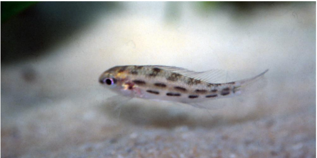
Dicrossus warzeli .

blev omtalt i Horst Linke og Wolfgang Staeck's bog "Amerikanische Cichliden I Kleine Buntbarsche" i et stykke om D. spec. "Peru", men i 1992 udgaven er navnet ændret, billedet identisk, men spejlvendt og udbredelsesområdet på kortet ændret, selv om der ikke er ændret noget særligt i teksten. Det skal derfor blive spændende at høre om nye fangster af denne Dicrossus i fremtiden. Denne fisk adskiller sig fra de andre 2 arter, ved at have 4 vandrette rækker af sorte skakbrætpletter på den hvide bundfarve, mod de andre arters 2 rækker. Dog har ungerne det første stykke tid, som de andre Dicrossus kun 2 rækker sorte pletter. Vand: 25-28 grader C. pH 5-5,5. Hårdhed 0.