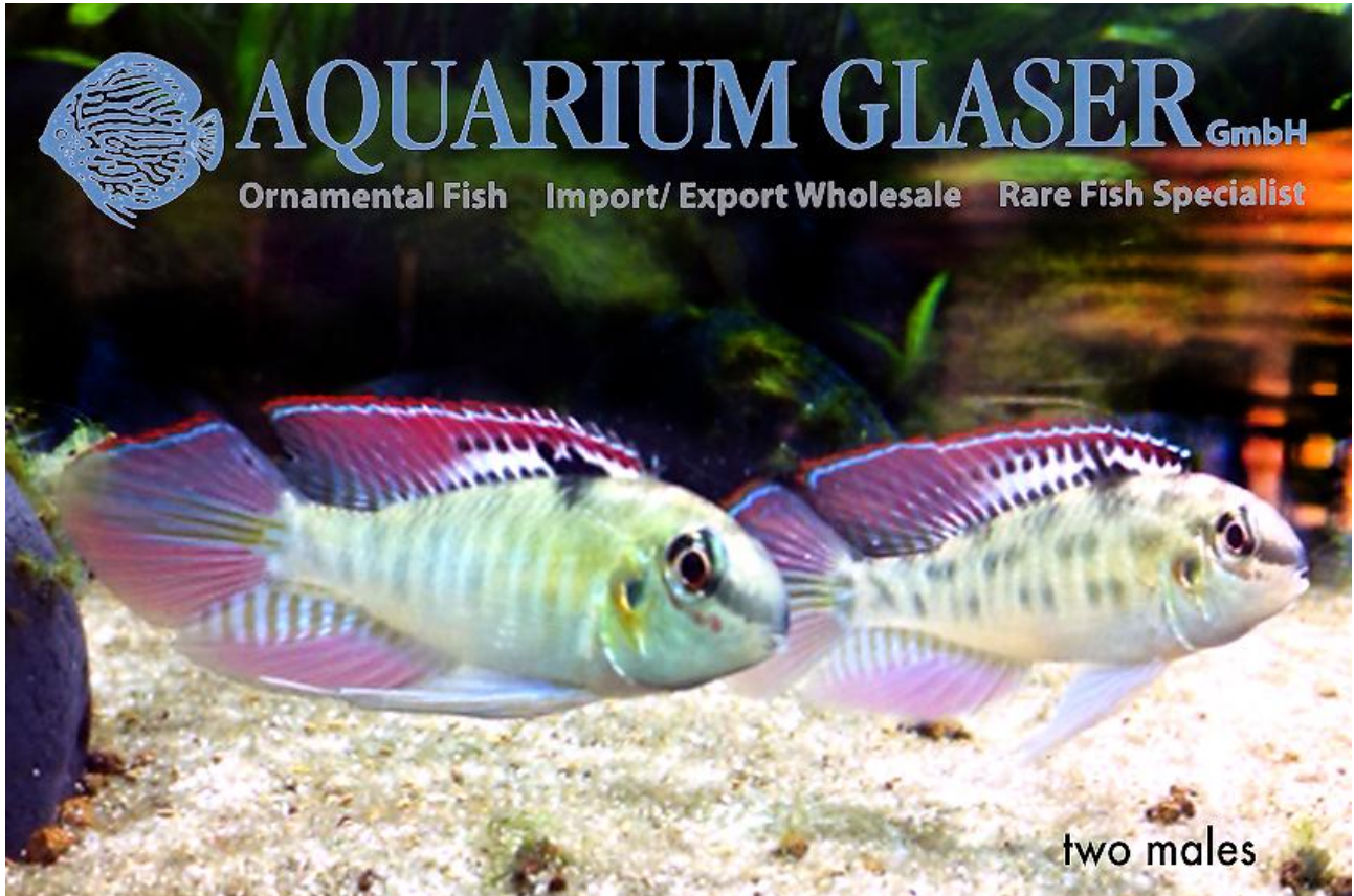
Dicrossus fornei , to hanner.