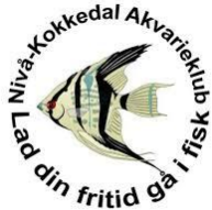
Nivå-Kokkedal Akvarieklub http://nk-akvarieklub.dk/