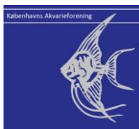
Københavns Akvarieforening http://www.kobenhavnsakvarieforening.dk/