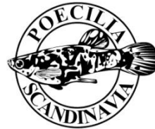
Poecilia Scandinavia https://poecilia.org/