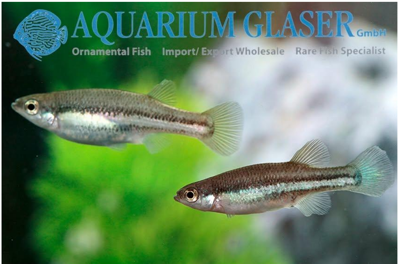
Ataeniobius toweri "Lago de Creda", hun og han.