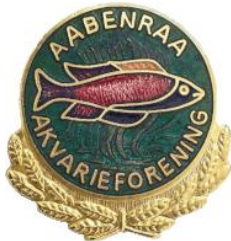
Aabenraa Akvarieforening https://aakvarieforening.dk/