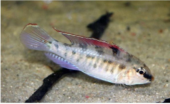
Dicrossus foirni , han.