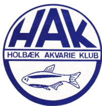
Holbæk Akvarie Klub https://www.akvarieklub.dk/