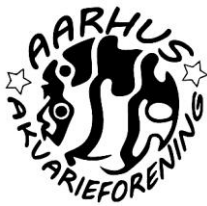
Aarhus Akvarieforening https://www.aarhus-akvarieforening.dk/