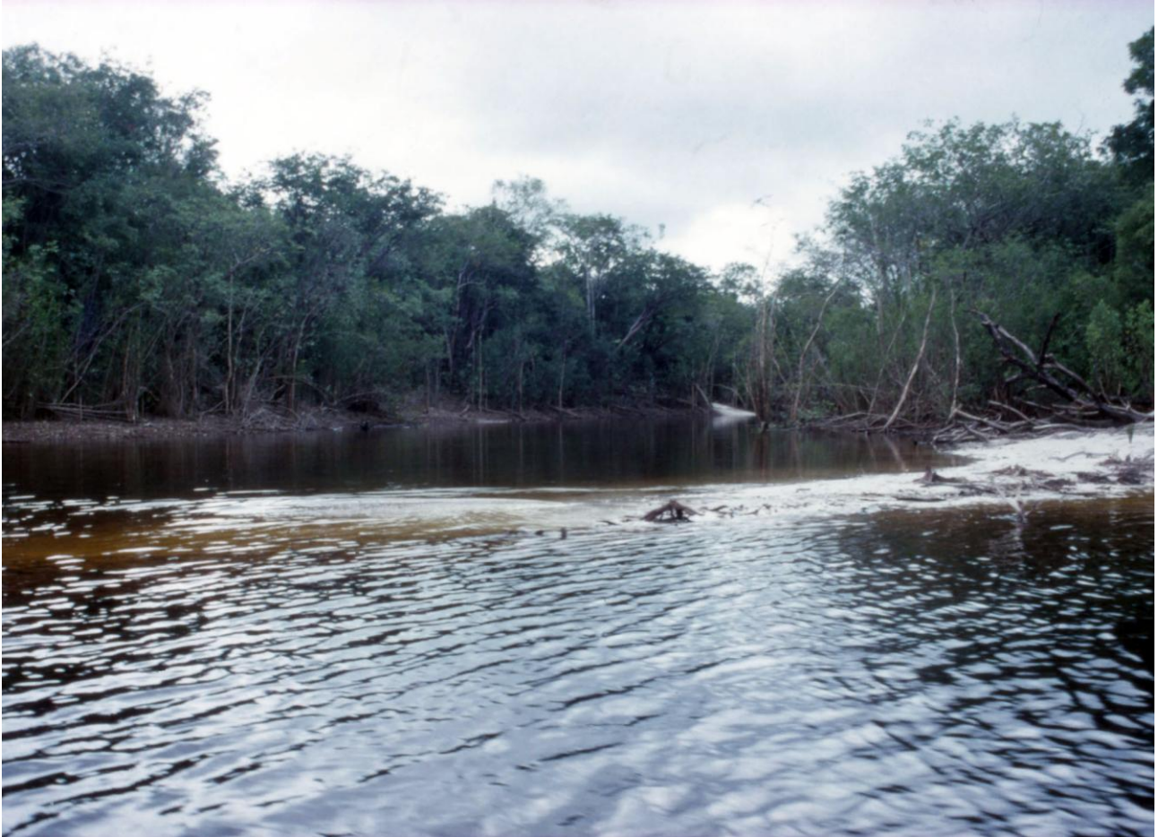
Lille biflod til Rio Apabapo hvor vi fandt Dicrossus gladicauda .

Vand: 25-28 grader C. pH 5,5-6. Hårdhed 0.