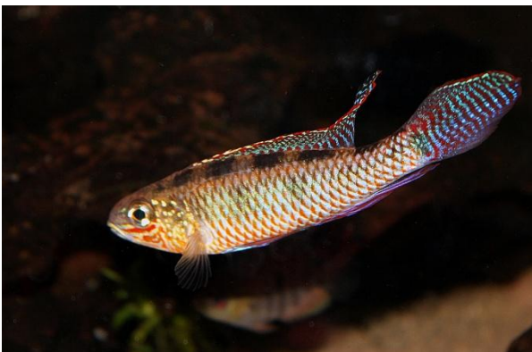
Dicrossus maculatus , han.