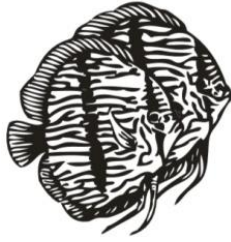
Vejle Akvarieforening https://vejleakva.dk/